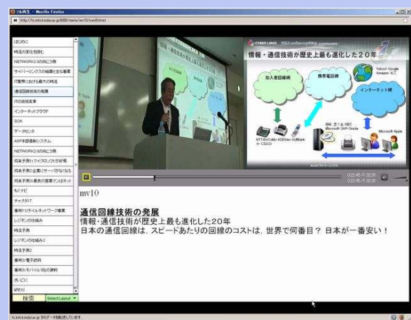
作成したコンテンツの再生 (Flash)