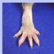
マンギフェリン 100mg/kg投与群