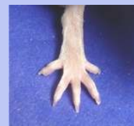
マンギフェリン 400mg/kg投与群