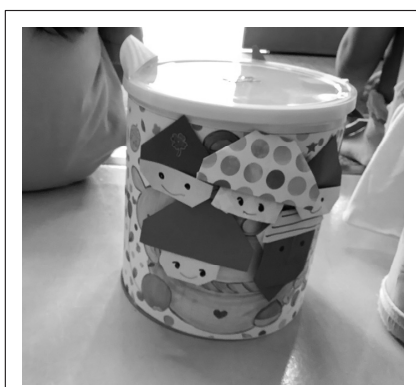
子どもたちが制作した太鼓の一例

5歳児くらいになると、予備で準備していたシールも貼ることが可能であり、好きなシールを画用紙に貼った折り紙とバランスを考えて貼る作業を行っていた。筆者が予想していた以上に、子どもたちの活動が集中していた為、子どもたちが思う存分作業ができるよう、様子を観察し完成へと導くことを行った。指導案では15分としていたが、実際には20分強程度の時間を子どもたちは集中することができていた。この時間は筆者にとって予想外であり、喜びを感じる瞬間となった。