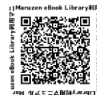
Maruzen eBook Library

※今回紹介した電子ブック以外にも「レポート・論文の書き方」に役立つ電子ブックがあります。