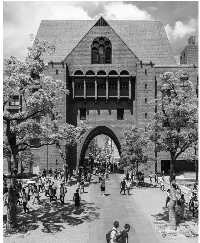
現在（令和2年）の西門