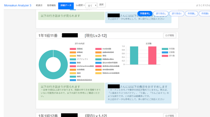
図2 改良後の教師用システム（個人名は黒塗り）

なお、教師用システムについては初年度の時点で改良を行うことができ、特別支援学級における学習者の特性の抽出（授業への集中度合いなど）や教師への指導推薦（こういった特徴の学習者にはこういった指導が良いという推薦）を行えるシステムを開発し、授業利用において有用であることが確認できた（図2）。