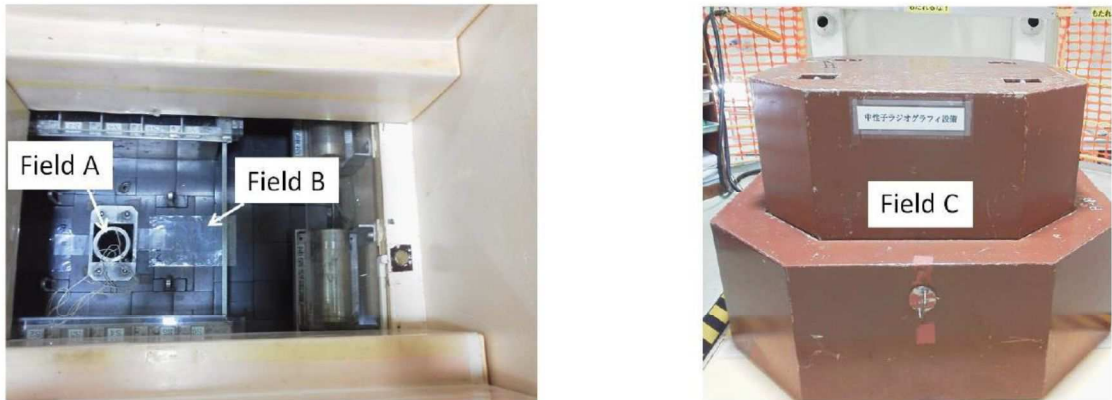
図 1. 原子炉設備における試料照射場所 Filed A、Filed B、Filed C

1]、1.2[Gy]、Field B では 1.5 \times 10^6 [ \text{n} \cdot \text{cm}^{-2} \cdot \text{s}^{-1} ]、 9 \times 10^{-2} [Gy]、Field C では 1.0 \times 10^4 [ \text{n} \cdot \text{cm}^{-2} \cdot \text{s}^{-1} ]、 1.5 \times 10^{-3} [Gy]である。