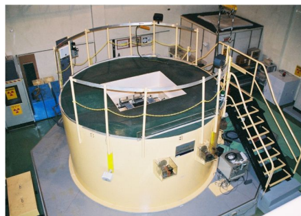
図1 近畿大学原子炉 UTR-KINKI

近畿大学が保有する原子炉(UTR-KINKI)は、大学における教育訓練を目的に設計された原子炉であり、1961年11月の初臨界以来、半世紀以上にわたって国内外の原子力専攻学生の教育に大いに活用されてきた。原子炉の熱出力はわずか1ワットであり、極めて安全性が高いため、学生が自ら原子炉を運転して実験、実習をすることができる。また、運転中も原子炉内は常温・常圧に保たれるため、原子炉を冷却する必要がなく、冷却機能を持たない。そのため構造が非常にシンプルで、原子炉として最小限の構成要素(燃料、制御棒、減速材、反射材、遮へい材、放射線検出器など)から構成されており、原子炉の原理を学ぶための基礎的な実験や、原子炉を中性子源として利用した中性子計測実験に適している。図1に近畿大学原子炉の外観を示す。