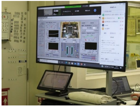
図3 仮想コンソールを用いた遠隔実習の様子

実習に参加した学生 38 名にアンケートを取ったところ、遠隔実習であっても現地にいるような感覚で実習に参加することができた、との感想があり、臨場感のある実習を提供できたようであった。また、仮想コンソールを使ったことにより実習が非常に分かりやすかったとの声も寄せられた。時系列グラフなど、情報が整理された形で表示される仮想コンソールには、現実の制御コンソールにはない見やすさや分かりやすさがあり、対面で実習を行う際にも活用できることが示唆された。さらに、遠隔実習に参加した学生の多くが、本物の原子炉を見たい、現地で実習に参加したい、との感想を寄せており、遠隔実習に参加することで、現地での実習参加への意欲を強くする効果があった。