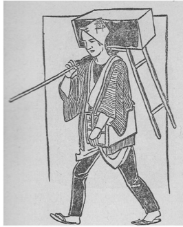
図2 立絵 今井『紙芝居の実際』 より抜粋