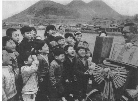
図3 街頭紙芝居 1971年の福岡県筑豊地区 鈴木『紙芝居がやってきた!』 より抜粋

治、大正期、縁日や祭礼になると小屋掛けといって芝居や見せ物の興行のために、境内に仮小屋が作られた。そこで演じられていた紙人形芝居（立絵）は、やがて縁日以外にも街頭に出て営業されるようになる。紙に絵を描いて切り抜き、竹串を付けた人形を動かして演じられる、現在のペープサートのような形式であった。紙に描かれていたことから、当時はこれを紙芝居と呼んだ。この紙人形芝居がさらに形を変え、絵の描かれた複数の紙を順番に抜いて場면을展開する、現在のような紙芝居へと発展した。平らな紙を見せることから平絵と呼ばれ、紙人形芝居の立絵と区別される。この平絵が街頭紙芝居の発端であり、昭和30年代まで子どもたちに絶大な人気を博した。