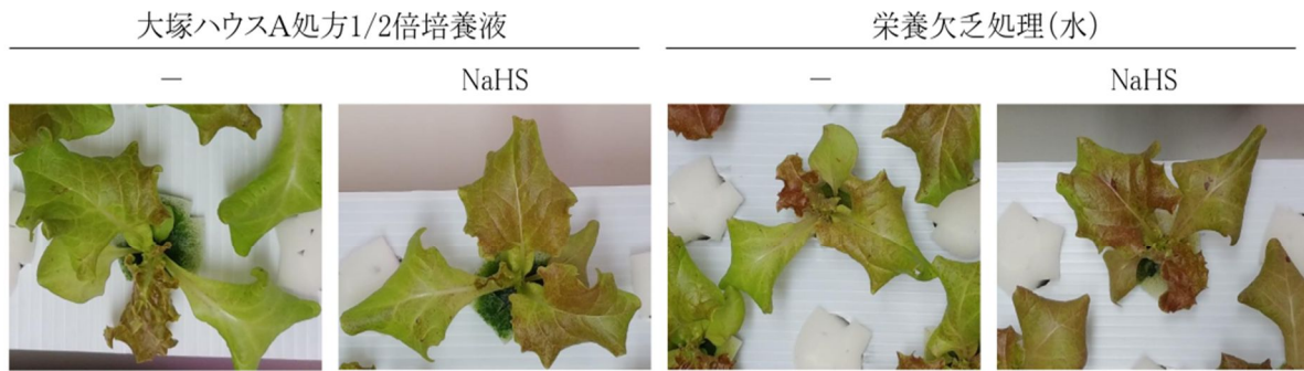
図2 培養液および栄養欠乏条件下の水耕栽培レタスの水耕液に硫化水素ナトリウム(NaHS)処理2日後のレタスの地上部の様子。

そこで、この栄養欠乏時のレタスの生理的な変化を観察したところ、栄養欠乏単独でもアントシアニン蓄積が誘導されることが明らかとなった。また、栄養欠乏時の硫化水素を定量したところ、アントシアニン蓄積時に根部で含量が増加することが明らかとなった(図3)。次に、栄養欠乏時の硫化水素誘導性アントシアニン蓄積現象においてエチレンと活性酸素種の関与を薬理的に調査した。硫化水素ナトリウムにエチレン前駆体の ACC を共処理するとアントシアニンの蓄積が促進された。このことから、硫化水素誘導性アントシアニン蓄積にエチレンが関与していることが考えられた。