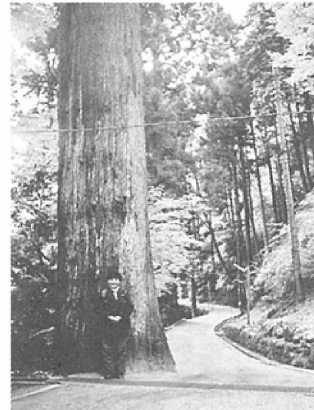
範宴（親鸞）9歳～29歳 修行の地