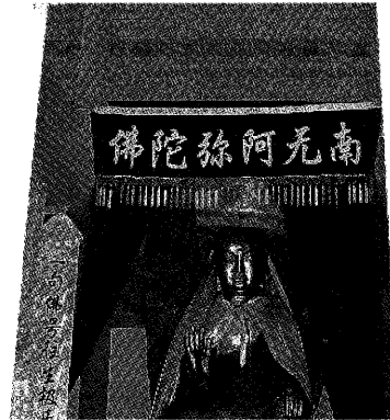
中国 洛陽 龍門石窟と南無阿弥陀仏 (2007年撮影)