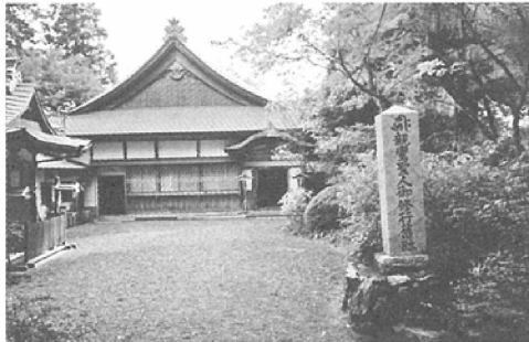
比叡山無動寺谷 大乘院