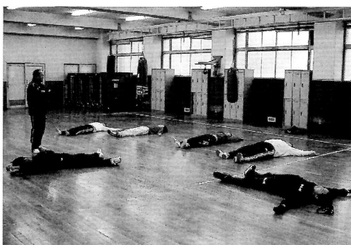
体ほぐし、体きづき