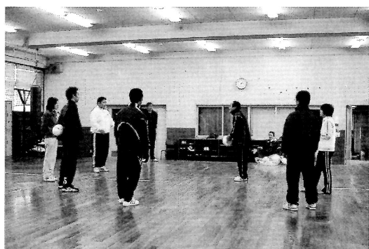
体ほぐし、体きづき