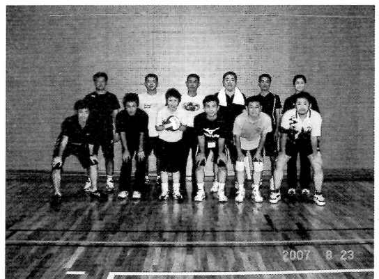
バレーボールコースー同

霧島は山のあちらこちらから温泉の蒸気が噴き出し、ホテル客室からは遠くに桜島と錦江湾を臨むことができた。天候にも恵まれ、猛暑の中、一人のけが人もなく無事に研修会が終了した。全国