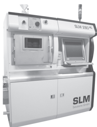
図2 導入した金属 3D プリンタの外観