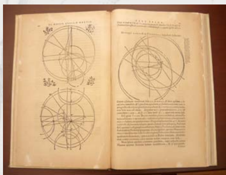
ケプラー 「新天文学」 1609年

そこで、今回の蔵書展は、天文学と生物学を中心に、後世に多大な影響を与えた15世紀半ばから19世紀にかけての貴重書を37点展示します。現代に至るまでの科学史の一端をぜひご覧ください。