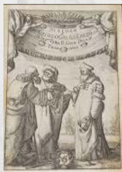
ガリレイ 「天文対話」 1632年