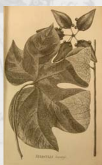
ツェンペリー 「日本植物誌」 1794-1805年